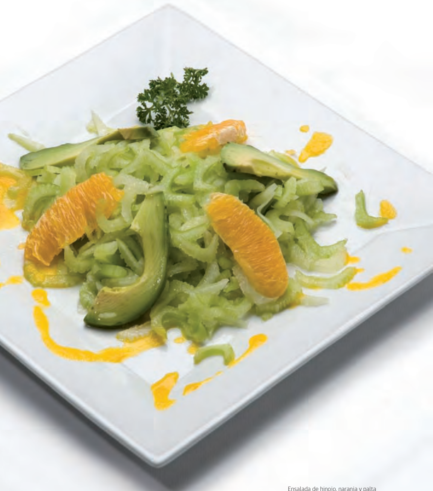
Ensalada de hinojo, naranja y palta