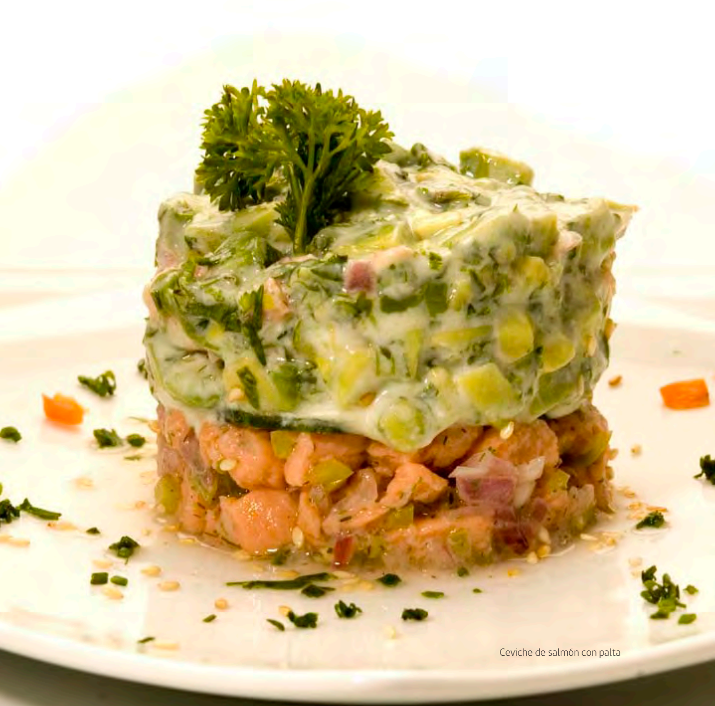
Ceviche de salmón con palta