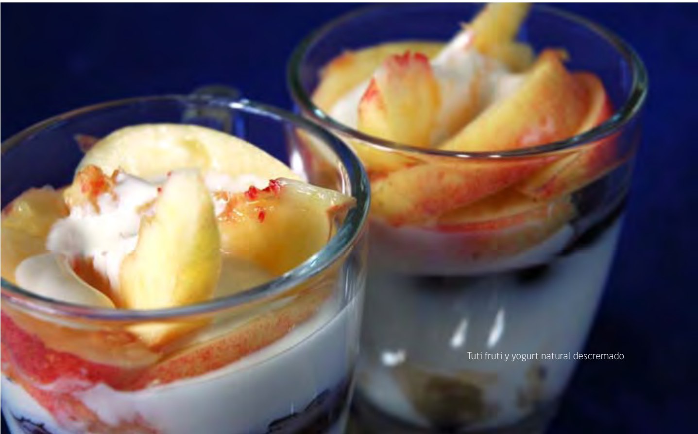
Tuti fruti y yogurt natural descremado

“Aumentar al doble el tamaño de la porción de verduras que come habitualmente”