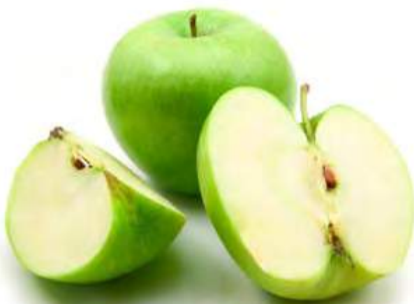
Ensalada California con suprema de pollo

Información nutricional por porción: Energía 78 kcal; proteínas 0 g; grasa total 0 g; colesterol 0 mg; carbohidratos 20 g; fibra 2,6 g; sodio 0 mg.